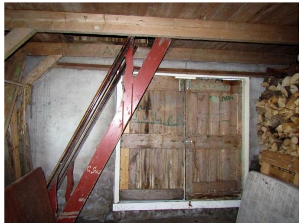
Binnenzijde straatkant met dubbele deur en trap.