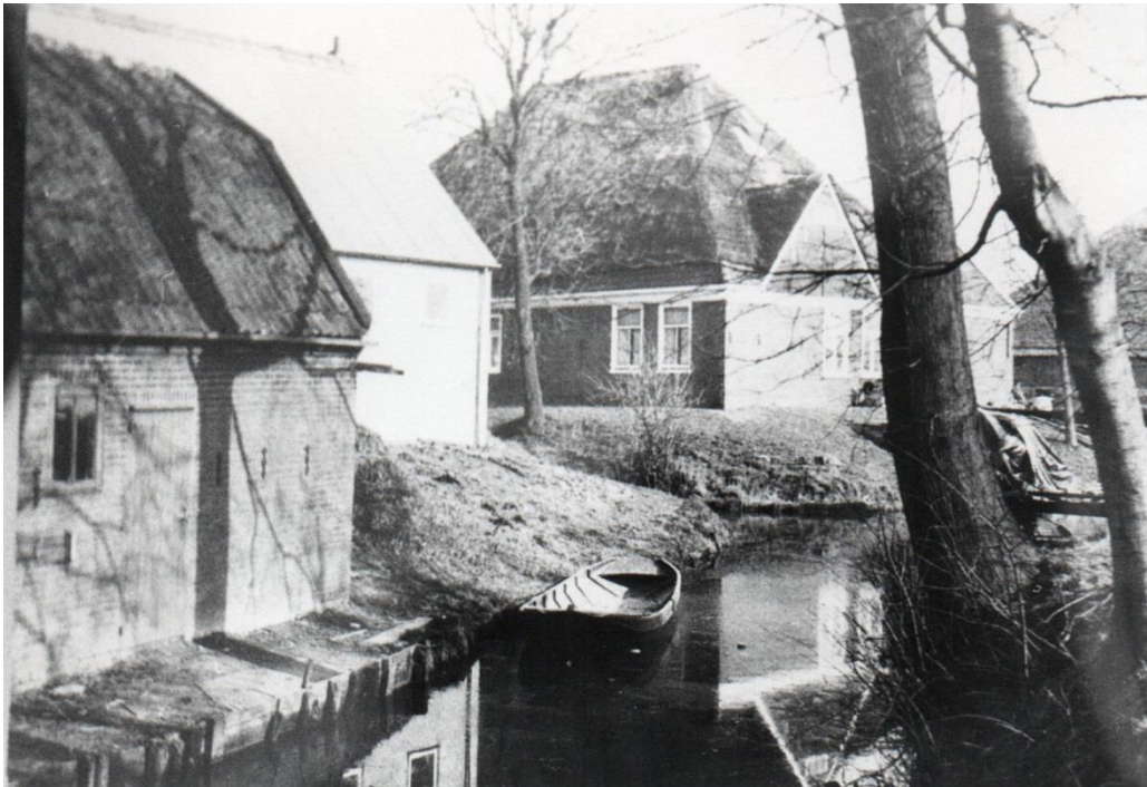
Zuiderpad met zicht op de boerderij van Teunis Klaver in de Tempel. Links de onderboet van Jaap Zwaan met zijn schuitje de aref

Een van de oudste koolboeten van Opperdoes staat aan het Zuiderpad nummer 2. Het pand, daterend uit 1901, bevindt zich vlak bij de Tuinsloot. De afmeting bedraagt circa 4,80x8,80 meter.