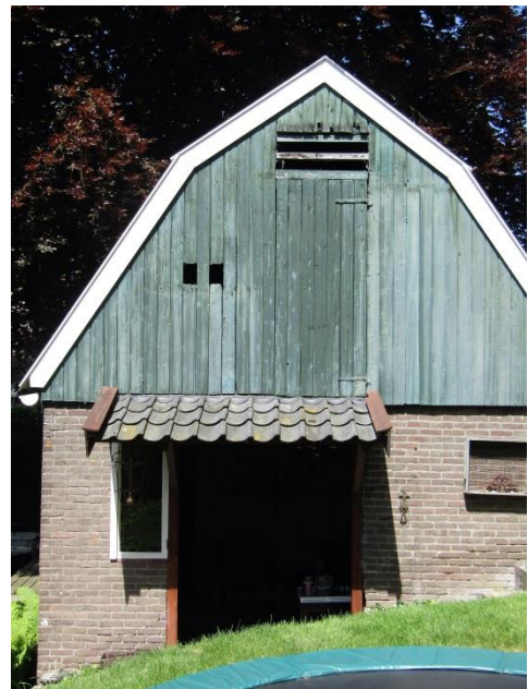
Ook aan de achterkant waren dubbele deuren, die nu zijn vervangen.

Na het rooien werden de bollen met de schuit (kloetend) aangevoerd vanaf het land. Aan de westmuur werd in de schuur een tafel gemaakt voor het pellen van de bollen. De tafel bestond uit losse planken die op schragen stonden. Het pel-afval werd zo onder de tafel geschoven (dus niet in manden). Op gezette tijden werd het afval met de schuit afgevoerd en naar het land gebracht waar het in de wal werd gestort.