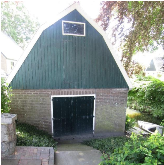
Dubbele deuren aan de voorkant