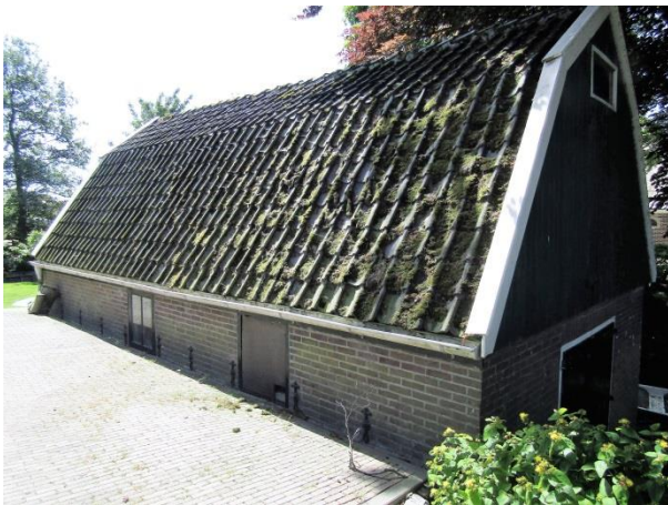
Het pad naar het huis met de laaggelegen schuur

De benedenverdieping werd gebruikt voor opslag van bewaarkool, wortels, bieten en uien. In de aardappelkamer stond de voorraad eetaardappelen voor eigen gebruik en het pootgoed.