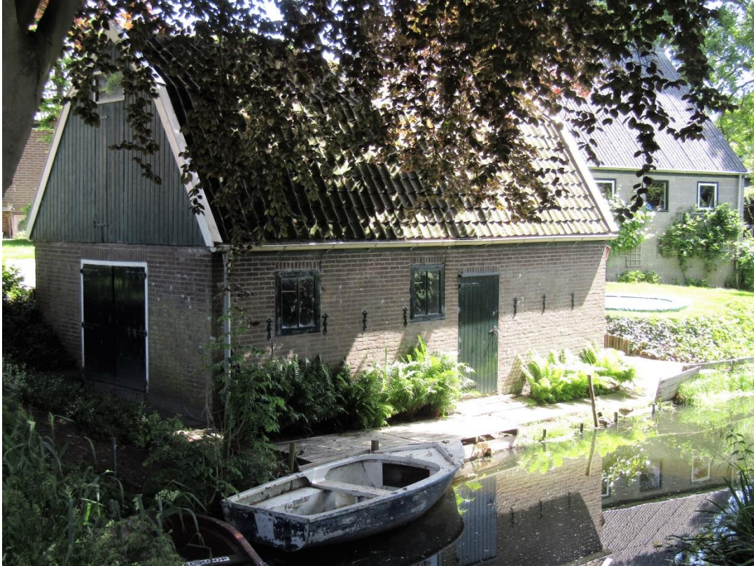
De schuur weerspiegelt in de sloot. De foto is gemaakt vanaf de brug.

De dubbele deuren aan de achterkant zijn vervangen. Van binnen is de schuur merendeels authentiek.