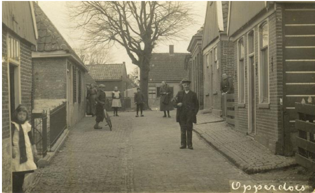
Zuiderpad, 1920. Het huis rechts is later gesloopt en er is een nieuw huis voor in de plaats gekomen dat meer achterwaarts is gezet.