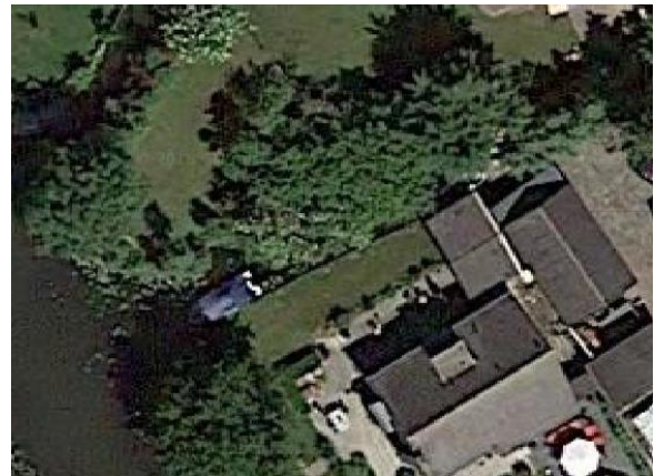
Achterzijde koolboet en water

Aan de achterkant is water: een inham van de Kromme Leek. Een nieuw gemaakte schuif ligt in de smalle sloot. Vroeger werden hiermee de producten van het land naar de schuur gebracht.