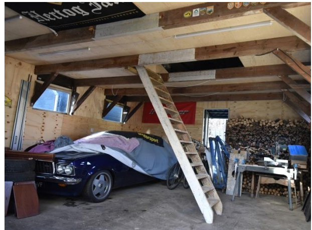
Aanzicht binnenzijde met trap