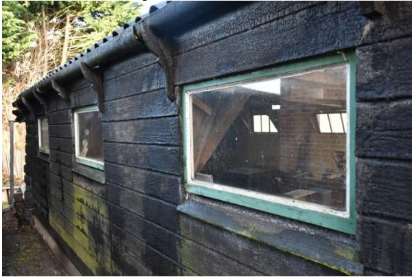
Detail goot, raam en klossen