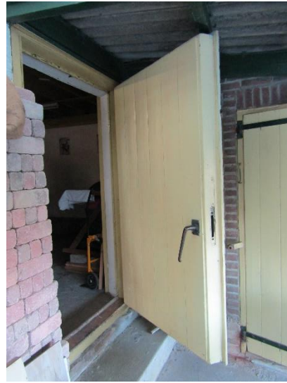
De robuuste deur naar de schuur