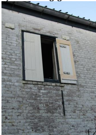
Zolderraam met luiken

Een ammoniak gekoelde installatie werd ingebouwd in een kleine ruimte achterin de schuur. Deze installatie koelde de ammoniak en dat werd geperst door de leidingen, die door het hele pand lopen. Toen Piet Veldman de schuur in '73 kocht werd dit systeem nog gebruikt. In 1976 werd een luchtgekoelde installatie geplaatst.