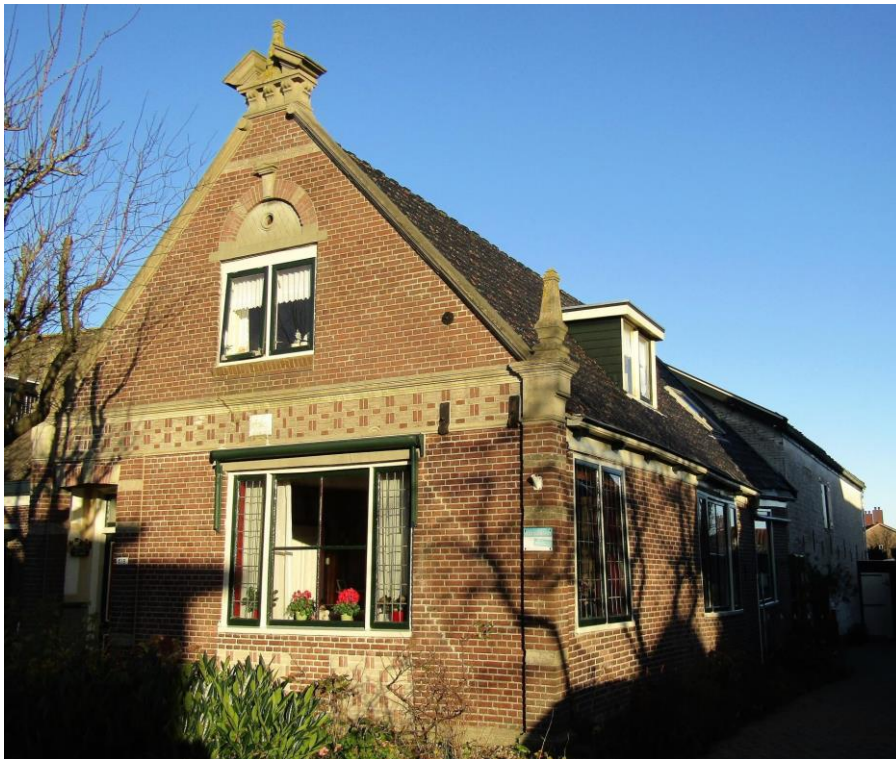
Het fraaie huis met koolschuur aan de Dorpsstraat.