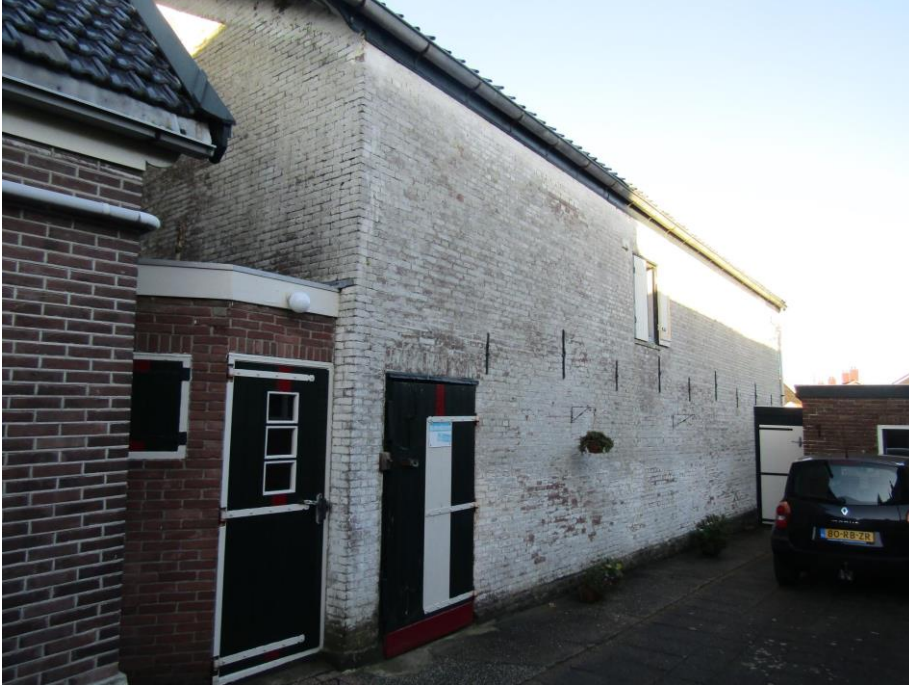
De hoge schuur vrijwel zonder ramen

Piet bewerkte grond die bestemd was voor uitbreiding van het dorp. Dat plan was echter in de ijskast gestopt. 'Het was perfecte grond, opgehoogd met bagger uit de sloten. Ik teelde er skoftig goeie piepers, goudgeel!' Na 1981 werden er huizen gebouwd op dit land en ging Piet werken als stratenmaker.