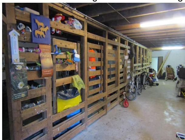
De hekken op de benedenverdieping zijn nog aanwezig