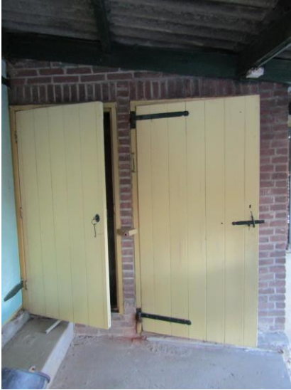
De deur naar de ruimte waar de koelinstallatie stond, achterin de schuur