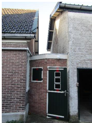
Verbinding tussen huis en schuur

De koolschuur achter het voorname huis is robuust en hoog. Tussen huis en schuur is een verbindingsdeel, maar de panden staan los van elkaar. Pal achter de schuur loopt de Achterburggracht. De kool werd destijds per schuit aangevoerd en via losse planken, die men tussen schuit en schuur legde, in manden naar binnen gebracht en zo ver mogelijk naar voren gedragen. Ook was er een liftje om de kool naar de eerste verdieping te transporteren.