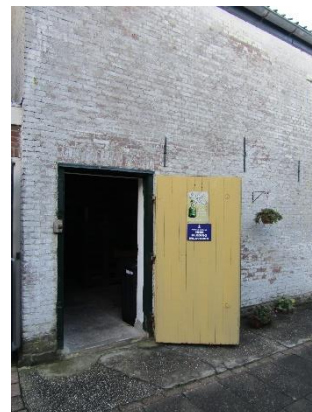
Toegangdeur naar de schuur