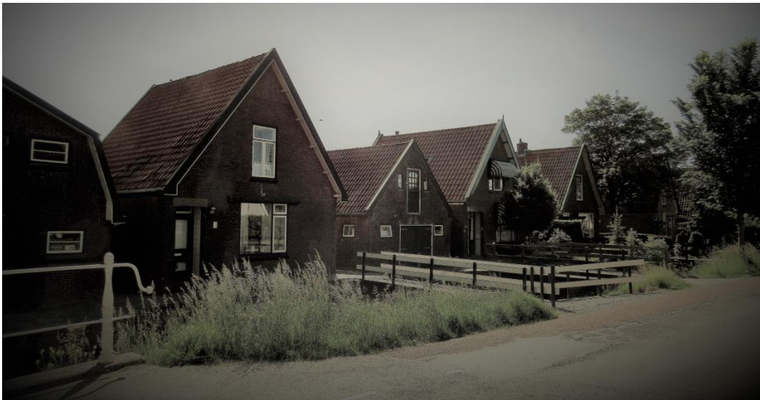
Huizen aan de Nieuweweg, gebouwd rond de jaren dertig van de vorige eeuw.

Aan de oostzijde van de Nieuweweg in Opperdoes staat een rij woningen, die zijn gebouwd rond de jaren '30 van de vorige eeuw. Bij een aantal ervan bevindt zich naast of achter het woonhuis een koolschuur.