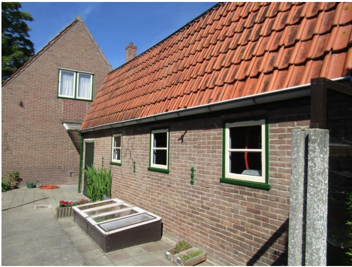
Zijkant van de schuur