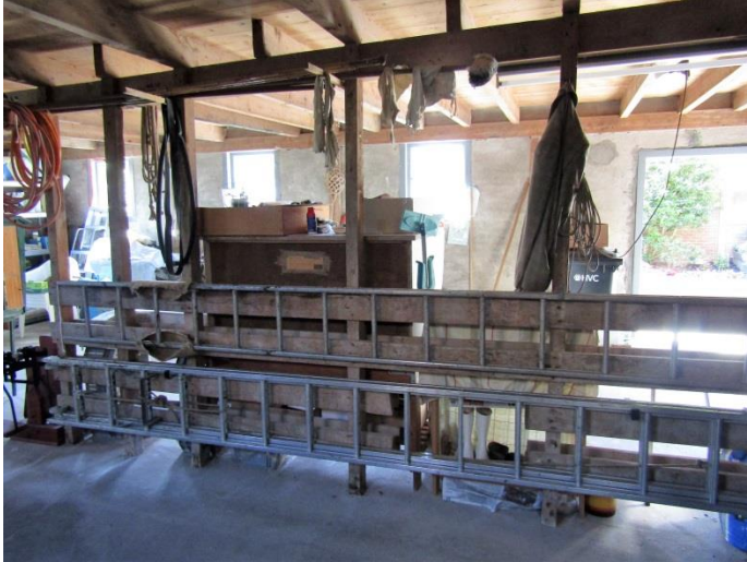
Rekken in het midden.

Aan de wegkant is nu een garagedeur in de schuur. Oorspronkelijk waren hier dubbele deuren. Van de stoep aan de sloot tot aan deze deuren liep een smalspoor. De kool werd per schuit aangevoerd en gelost op een lorrie. Die lorrie reed tot in de schuur.