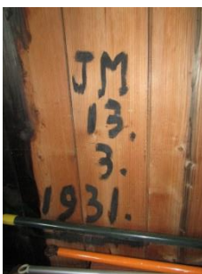
Tekst in het dakbeschot van de schuur: J(an) M(eurs), 13 maart 1931.