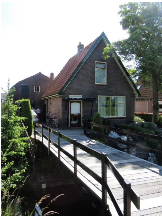
Woning en schuur.