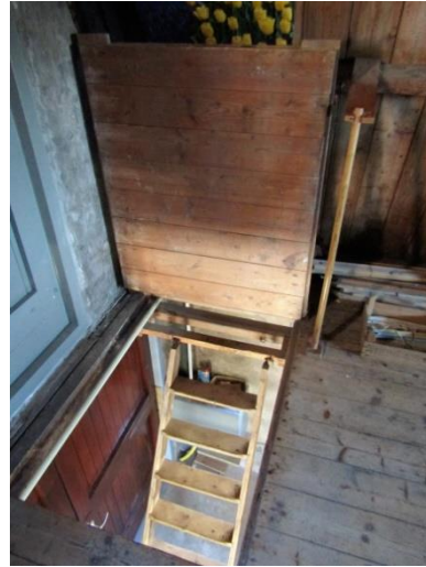
Trap naar de bovenverdieping

In het midden van de schuur staan de bekende houten hekken. De kool lag opgestapeld op de aarden vloer, er was een verhoogde plank in het midden die diende als looppad.