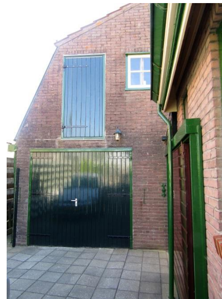
Aangezicht schuur aan de wegzijde met garagedeur. Hier waren vroeger dubbele deuren

Een stevige houten trap voert naar de verdieping. Meteen rechts is de aardappelkamer, een afgescheiden ruimte met een kachel erin. Daar werden de pootaardappelen bewaard. Ook op de benedenverdieping kon een kachel staan om de kool uit de vorst te houden.