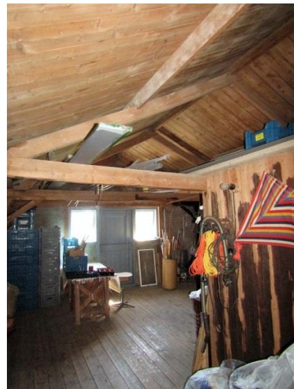
Bovenverdieping met rechts de ingetimmerde aardappelkamer.