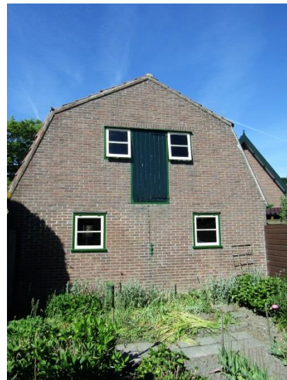
Achterkant van de schuur