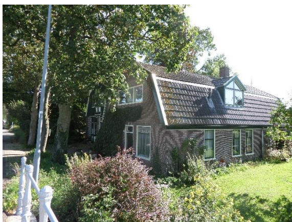
Woonhuis en werkplaats.