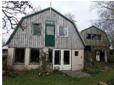
Achterzijde woonhuis en werkplaats.