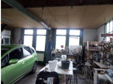
Interieur werkplaats met zicht op de dubbele deuren aan de wegzijde.

Op de begane grond dubbele deuren en een hoog geplaatst raamkozijn. In de zijgevel een hoog geplaatst raamkozijn. Behoudens de hooggeplaatste raamkozijnen, vanwege de noodzakelijke lichtinval, herinnert niets aan de voormalige bestemming als schilderswerkplaats. De ruimte wordt gebruikt als schuur en autostalling.