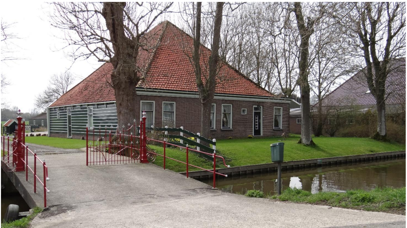
Stolpen in Oostwoud

De winnaars worden eind juni bekendgemaakt. De hoofdprijs is een overnachting voor twee personen voor twee nachten in de stolpboerderij Tulpen & Zo in Julianadorp. De winnaar van de tweede prijs mag voor 150 euro uit eten in restaurant de Bokkesprong in Groet (uiteraard ook een stolpboerderij) en de derde prijswinnaar krijgt een boekenbon van 50 euro.