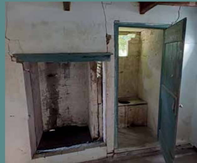
De vuurplaats met daarnaast de plee.

De zware schoorsteen begint te wijken, die staat immers op veengrond. Nico stelt: „Zolang hij niet omvalt, laat ik hem staan.”