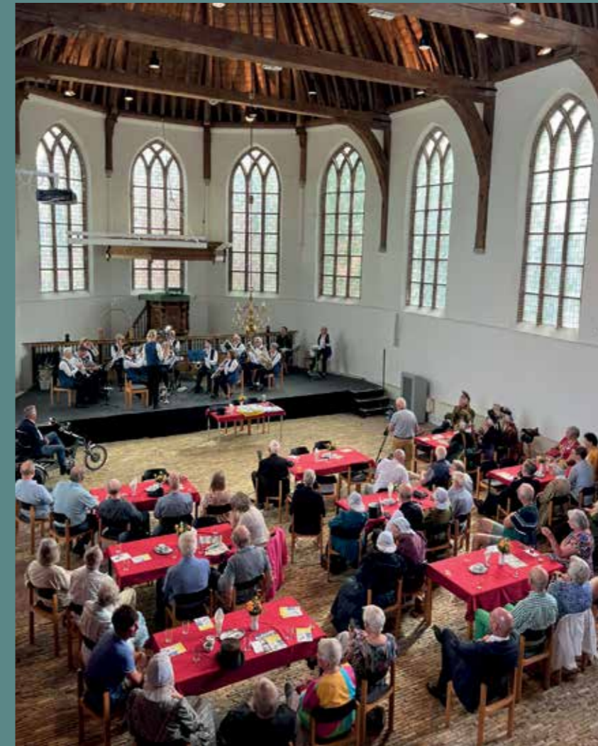
Blik op de zaal tijdens het optreden van muziekvereniging Sint Caecilia uit Zwaag.