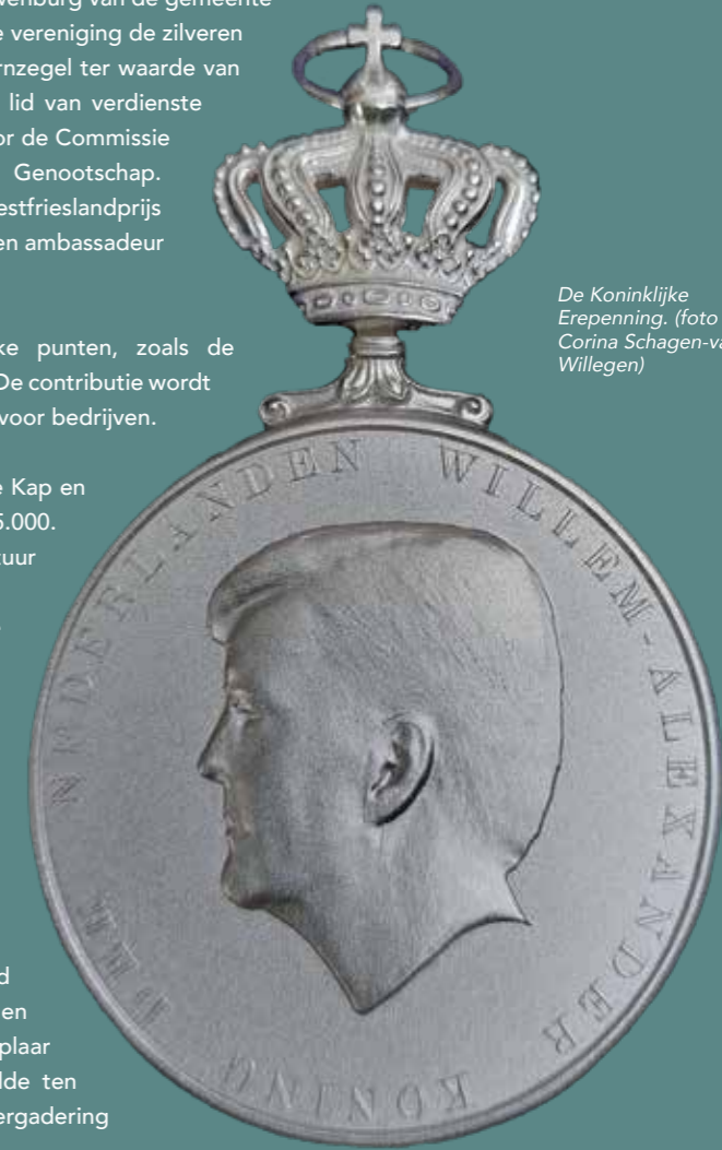
De Koninklijke Erepenning.

Foto's van de Westfriezendag op de volgende pagina.