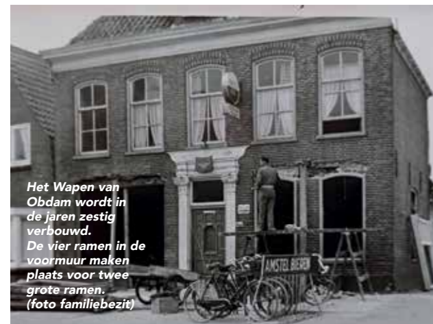
Het Wapen van Obdam wordt in de jaren zestig verbouwd. De vier ramen in de voormuur maken plaats voor twee grote ramen.

Het café ging vroeg open, om half negen. Achter ons stond veiling De Tuinbouw. De mannen van De Transport, toentertijd een soort personeelspool, kwamen daar om negen uur vandaan om koffie te drinken.