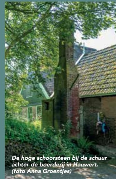
De hoge schoorsteen bij de schuur achter de boerderij in Hauwert.

Nico toont de diepe kelder, de afmeting bedraagt ongeveer 3.50 bij 2.20 meter. Daarnaast staat een robuuste oude kast. „Ik denk dat die gebruikt werd voor het opbergen van de kaasattributen. Naast de stookplaats is later een plee gebouwd. Maar toen werd hier natuurlijk allang geen kaas meer gemaakt.”