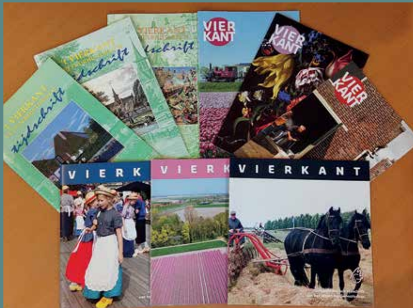
Hoe het Vierkant evolueerde. Met de eerste uitgave linksboven.