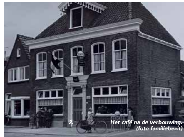
Het café na de verbouwing.

We waren zes en een halve dag per week geopend, alleen op woensdagmiddag bleef de deur dicht. Er was veel reuring in het café. Vertegenwoordigers en ook mannen uit de bouw kwamen koffie drinken, met schafttijd gingen zij ook naar de kroeg. Er waren drie biljartclubs en het was het voetbalcafé. Als de wedstrijd 's zondags niet doorging, werd er geklaverjast, dat was vast pandoer. Er werden gauw prijsjes gehaald en dan zaten er zo dertig of veertig man te klaverjassen.