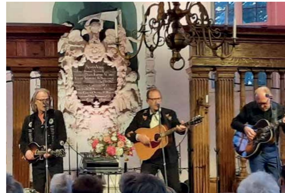
De Westfriese band Skotwal. (foto aangeleverd)