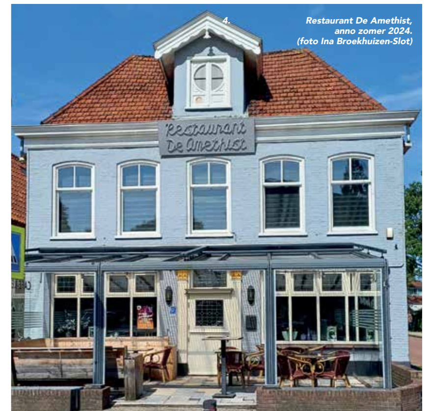
Restaurant De Amethyst, anno zomer 2024.