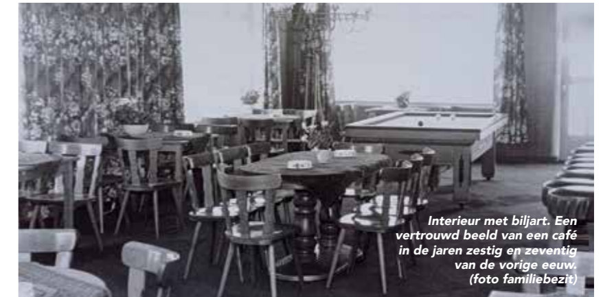
Interieur met biljart. Een vertrouwd beeld van een café in de jaren zestig en zeventig van de vorige eeuw.

Het Wapen van Obdam werd in 1975 overgenomen door Herman Vriend. Hij was eigenaar tot circa 2015. Op 1 oktober 2015 begon hier restaurant De Amethyst dat van woensdag tot en met zondag is geopend. Achter in het pand zijn appartementen gerealiseerd.